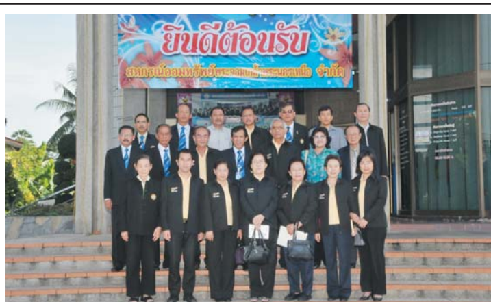
คณะกรรมการ ที่ปรึกษา ผู้ตรวจสอบกิจการและเจ้าหน้าที่ สภกรณ์ออมทรัพย์พระจอมเกล้าพระนครเหนือ จำกัด มาศึกษาดูงานและเยี่ยมชมกิจการสภกรณ์ ในวันที่ 13 กรกฎาคม 2554

การจัดทำบัญชีรายรับ รายจ่าย และเงินออมในชีวิตประจำวันของสมาชิกสภกรณ์ออมทรัพย์ครูปทุมธานี จำกัด ถือเป็นการฝึกการมีวินัยทางการเงิน เพื่อให้รู้ว่าพฤติกรรมค่าใช้จ่ายของตัวเองเป็นอย่างไร เพื่อให้รู้เท่าทันอุปนิสัยของตัวเองจะได้ไม่เดินไปตามความอยากมากนัก ให้ยึดหลักเศรษฐกิจดำเนินชีวิตแบบเศรษฐกิจพอเพียง คือพออยู่พอกินไม่ฟุ้งเฟ้อ โดยพยายามรักษาสมาดุลระหว่างรายรับ กับรายจ่ายให้พอดีกัน ไม่ให้ห่างกันจนเกินไป และไม่ลืมที่จะต้องเก็บออมไว้บางส่วน เพื่อใช้ความจำเป็นในอนาคต โดยมีข้อมูลที่เกี่ยวข้องกับการวางแผนการเงินดังนี้