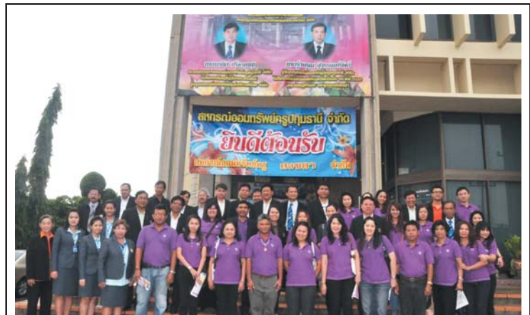
คณะกรรมการ ที่ปรึกษา ผู้ตรวจสอบกิจการและเจ้าหน้าที่ สภกรณ์ออมทรัพย์ครูสงขลา จำกัด มาศึกษาดูงานและเยี่ยมชมกิจการสภกรณ์ ในวันที่ 14 กรกฎาคม 2554