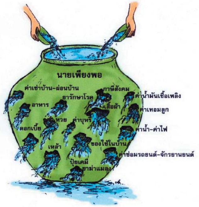
"พวกเราเลือกหาน้ำใส่ตุ่ม หรือจะเลือกอุดรูรั่วตุ่มก่อน?"

คนเราบางครั้งขาดการยับยั้งชั่งใจในการใช้จ่าย ทำให้ไม่ค่อยประหยัดกัน โดยทำตามความอยากของตนเองอยู่ตลอดเวลา อันนำไปสู่อุปนิสัยแห่งความเป็นหนี้ โดยไม่รู้ตัว เพราะขาดเสาเข็มในการยึดมั่น หรือควบคุมซึ่งนั่นก็คือ การจัดทำบัญชีรายรับ รายจ่าย และเงินออม เพื่อไว้เตือนสติของตนเอง